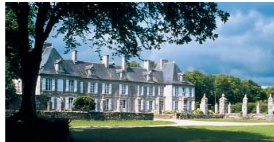
Traumschloss in der Bretagne: Ein Ferienhaus im Park des Château de Guilguiffin gibt's ab 630 Euro pro Woche, Zimmer ab 55 Euro. www.chateau-guilguiffin.com

Sicherheit bis zum Service stehen in der großen Tabelle auf Seite 58.